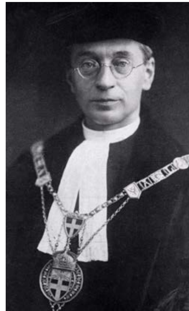
Beeld rechts Titus Brandsma als rector van de KU Nijmegen (1932)

'Onderzoek naar spiritualiteit en mystiek vanuit een multidisciplinaire invalshoek'