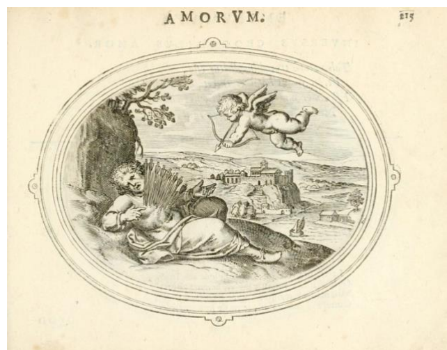
Otto Venius, Tellorum silva pectus , uit: Amorum Emblemata , 1608

Nu is liefde – en daarmee bedoel ik het liefdesverlangen, het hunkeren naar de geliefde – sowieso nooit zonder pijn. Een pagina uit een emblemataboek van Otto Venius uit 1608 illustreert dit raak. We zien er een minnaar, wiens hart letterlijk wordt getroffen door een overvloed aan liefdespijlen. Hier gaat het echter om ‘gewone’, erotische liefde, niet om devote liefde voor de goddelijke Bruidegom. Maar ook die liefde is daarom niet minder brandend, hunkerend en in die zin erotisch van aard. Laat ik dit, bij wijze van afsluiting, illustreren met een