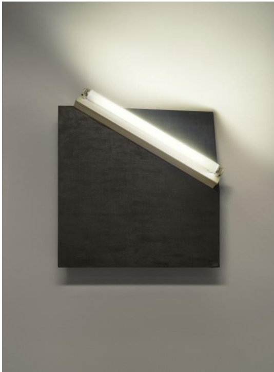
Dan Flavin, Icon VII (Via Crucis) , 1962-1964