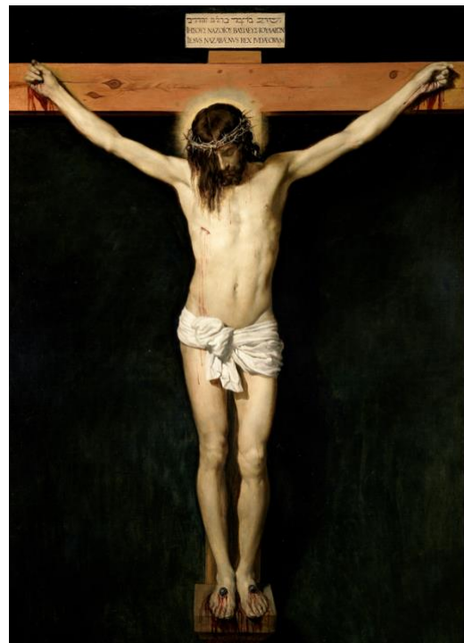
Diego Velázquez, Gekruisigde Christus , 1632

Dus inderdaad; waarom zoomt de christelijke iconografie zo op dood, pijn en lijden in? Wat maakt dat de beloftevolle weg die het christendom predikt, een beeldcultuur geeft waarin een marteltuig en een gemartelde centraal staan?