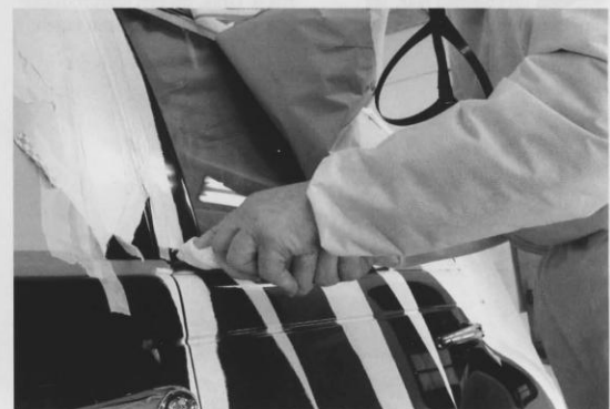
⊖ Voorzichtig wordt papier en plakband verwijderd.