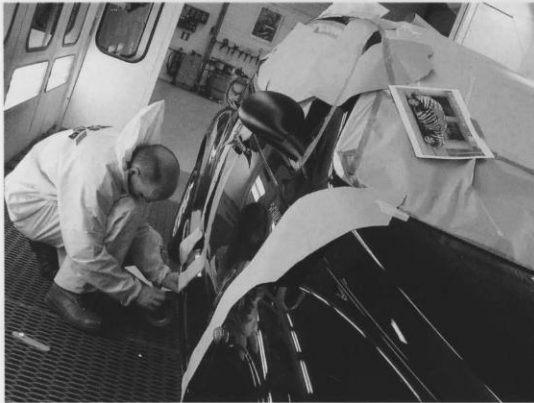
⊖ Veel tape en veel afplakpapier om het gewenste strepenpatroon aan te brengen.