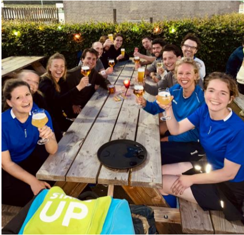
Team 2 PV Hockey