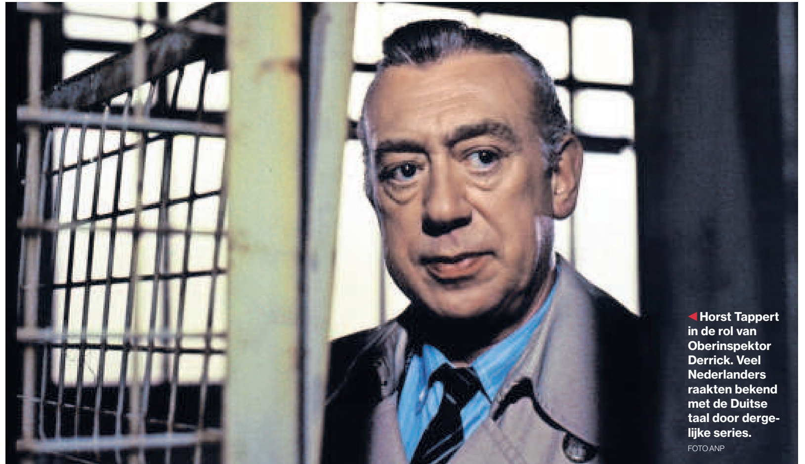
◀ Horst Tappert in de rol van Oberinspektor Derrick . Veel Nederlanders raakten bekend met de Duitse taal door dergelijke series.

Dat het belang van Duits pas zo laat tot ons doordringt, heeft te maken met het feit dat oudere generaties op een ontspannen manier en bovendien gratis Duits hebben geleerd. In de tijd van de antenne op het dak keken grensbewoners nog naar Die Sendung mit der Maus . Duits drong vanzelf tot je oren door en de bijbehorende grammatica kreeg je op