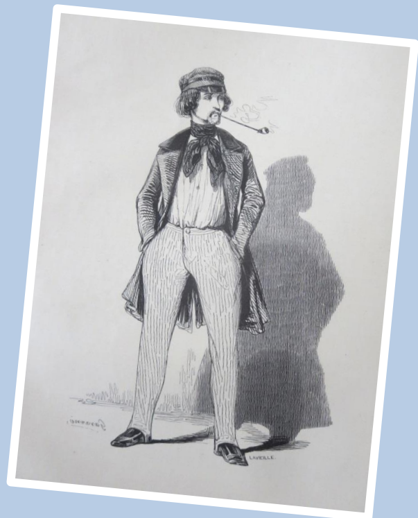
Paul Gavarni, Een Parijse rechtenstudent , ca. 1840, uit: Les Français peints par eux-mêmes .