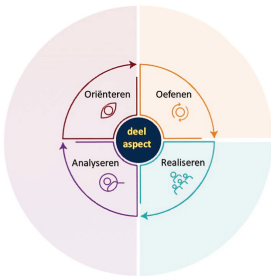
Figuur 4. Didactisch procesmodel.

Studenten werken bij alle cursussen, dus ook tijdens het werkplekleren, aan hun ontwikkeling binnen de kernpraktijken. We zetten daarvoor een specifieke opleidingsdidactiek in die is gevisualiseerd in onderstaand procesmodel.