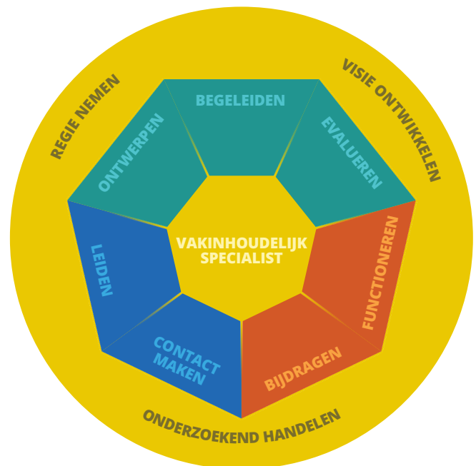
Figuur 1. De kernpraktijken zijn verbonden aan de drie rollen van de docent: vakdidactisch specialist (groen), pedagoog (blauw) en professional (oranje). Door de kernpraktijken heen lopen drie belangrijke lijnen (geel) en in het midden staat de vakinhoudelijk specialist.

Het werken aan de kernpraktijken gebeurt aan hand van een specifieke opleidingsdidactiek die verderop zal worden toegelicht (zie hoofdstuk 3, Begeleiding).