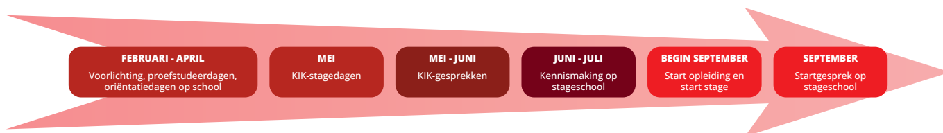
Figuur 4. Overzicht van de oriëntatieperiode: Krachtig in Interactie Kennismaken.