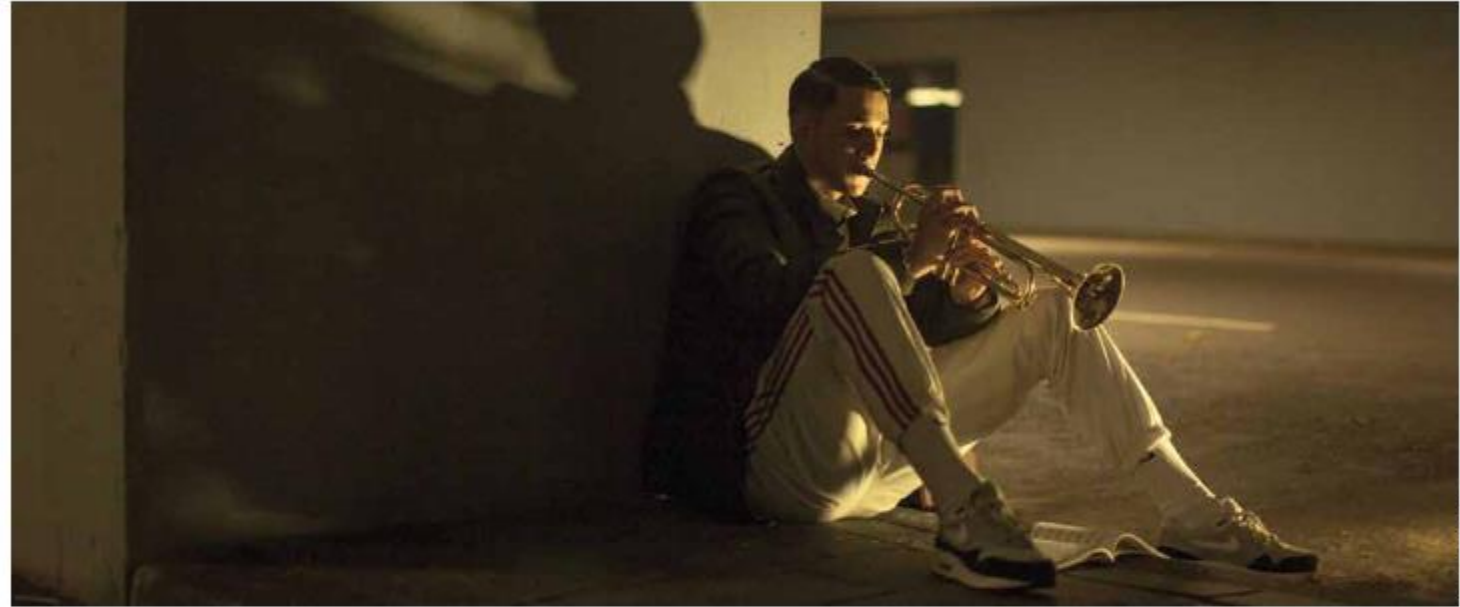
De foto van Pils

Literatuur en film: het is een veelbesproken relatie. Toch is er maar erg weinig bekend over de manier waarop films in het literatuuronderwijs worden ingezet. In deze bijdrage maken Koen Grubben en Jeroen Dera de balans op voor het vak Nederlands. Hoe vaak worden films eigenlijk ingezet in de literatuurles? En als we dat doen, hoe kunnen we dat dan het beste aanpakken?