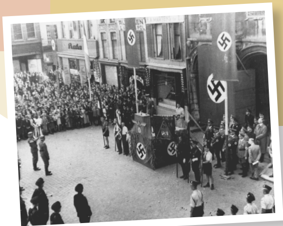
NSB'ers en SS'ers bijeen op de Grote Markt in Nijmegen.