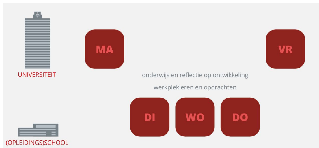
Figuur 3. Leren op de universiteit en leren in de schoolpraktijk

Op maandag en vrijdag volg je onderwijs op de universiteit. Dinsdag tot en met donderdag ben je bezig met werkplekleren in een (opleidings)school. Wat je op maandag leert in de cursussen die je volgt, kun je dus meenemen in de schoolpraktijk. Op vrijdag is er ruimte om de ervaringen en inzichten die je in die week hebt opgedaan te bespreken. Zo ontstaat er een samenhangend leerproces in je ontwikkeling naar startbekwaam academisch docent. Als je de opleiding in deeltijd volgt, als Trainee in Onderwijs of als Zij-instromer dan volg je het onderwijs aan de universiteit op maandag.