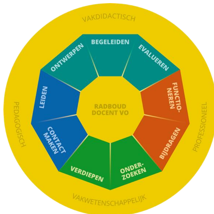
Figuur 1. De negen opleidingsdoelen.

In de opleiding staan opleidingsdoelen centraal; herkenbare beroepshandelingen die horen bij de rollen van de docent. Als vakdidactisch specialist ontwerpen de studenten effectief onderwijs, begeleiden ze het leerproces en toetsen ze of de leerlingen voldoende hebben geleerd. Als pedagoog creëren ze een positief leef- en leerklimaat. Ze bouwen een band op met de klas en met individuele leerlingen en stimuleren hun sociaal-emotionele ontwikkeling. Als professional zijn ze ook buiten de lessen actief in de schoolorganisatie en dragen ze bij aan de maatschappelijke opdracht van het onderwijs. Als vakwetenschappelijk bekwaam docent bevragen ze de onderwijspraktijk kritisch en verbeteren ze de onderwijspraktijk vanuit onderzoek.